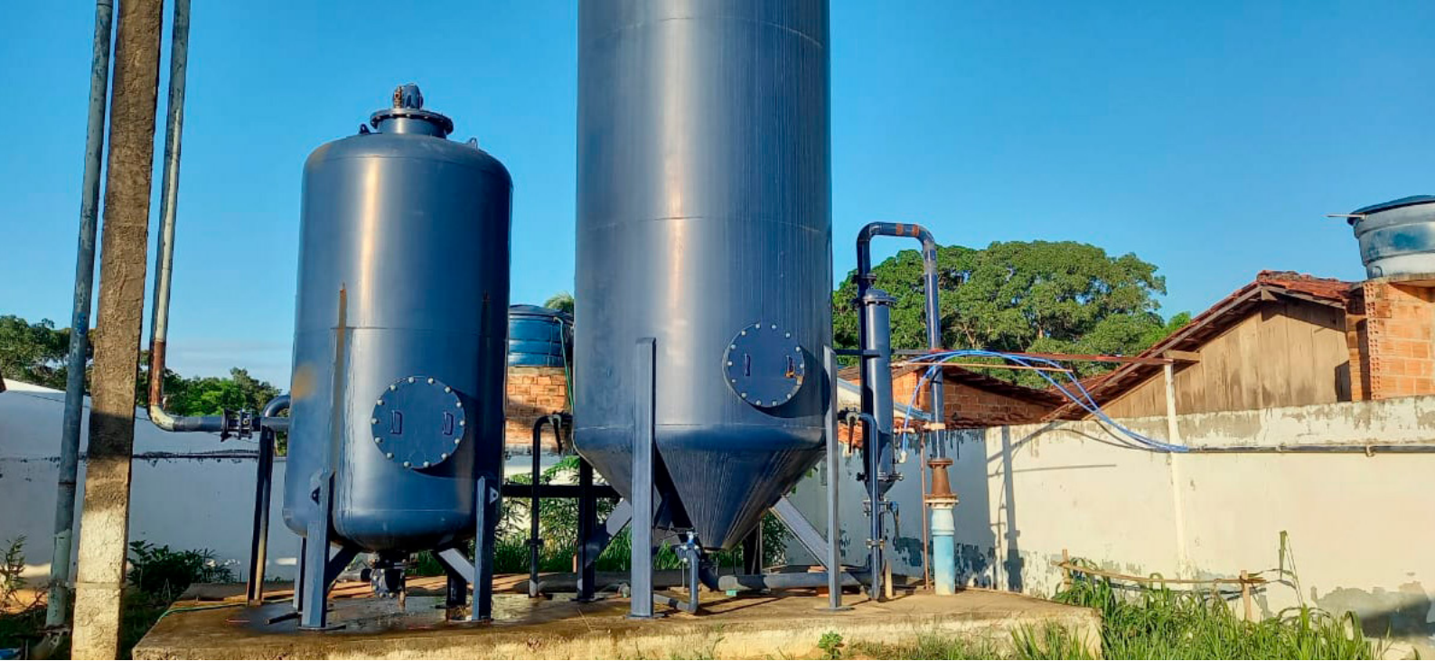
Captação de água no município é realizada pelo rio Paraíso e tem capacidade de fornecer água tratada para 900 famílias sem interrupção.

grande missão de fazer o sistema operar.