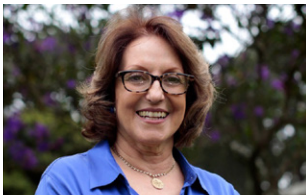
Thelma Krug, vice-presidente do Painel Intergovernamental sobre Mudança do Clima (IPCC)

Chuvas fortes podem sobrecarregar os sistemas de esgoto e água, o que merece atenção das companhias que oferecem os serviços à população. Segundo Thelma, se a manutenção não for foco, eles podem colapsar devido à capacidade limitada de drenagem das cidades mais antigas ou à falta de drenagem nos assentamentos não planejados, muito comuns em centros urbanos. “Esses sistemas são também vulneráveis à elevação do nível do mar, com ingresso de água salgada, entre outros impactos. Desta forma, os governos locais responsáveis pelo suprimento de água e gestão das águas residuais devem confrontar os novos padrões climáticos e responder a um conjunto de fatores dinâmicos e em evolução”, completa a especialista.